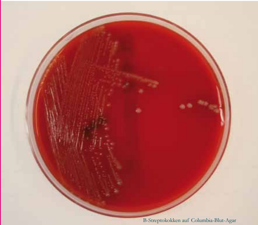
B-Streptokokken auf Columbia-Blut-Agar

Jedes zweite Neugeborene von Müttern mit positivem B-Streptokokken-Nachweis wird nach vaginaler Entbindung mit diesen Bakterien besiedelt.